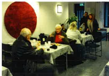
Gott med fika på invigningen

I slutet av november invigdes den nya föreningslokalen på Sibeliushöjden 52 med öppet hus och fika. Renoveringen drog ut på tiden på grund av händelser vi skrivit om i tidigare nummer av Porkalen. Nu kan alla boende äntligen hyra vår fräscha föreningslokal.