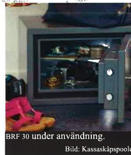
BRF 30 under användning.