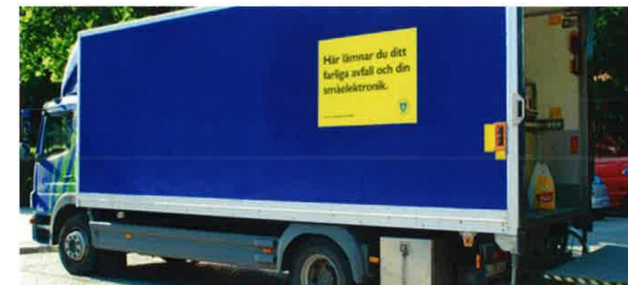
En av Stockholm Stads mobila miljöstationer som åker runt stan för att samla ihop farligt avfall och småelektronik från stockholmarna.

Inga miljöfarliga sopor får lämnas i grovsoprummen, slängas i sopnedkastet eller hällas ut i avloppet. Exempel på dessa är lösningsmedel, kemiska restprodukter, målarfärg, bilbatterier m.m. Dessa lämnas antingen på kommunens soptipp eller i den ambulande