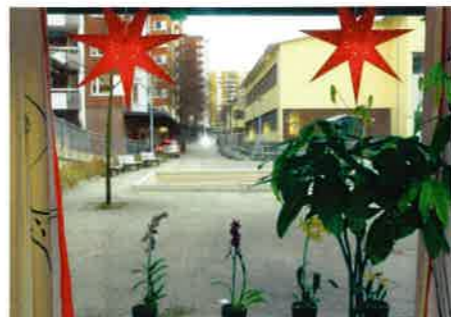
Utsikten från "lounge"-delen.