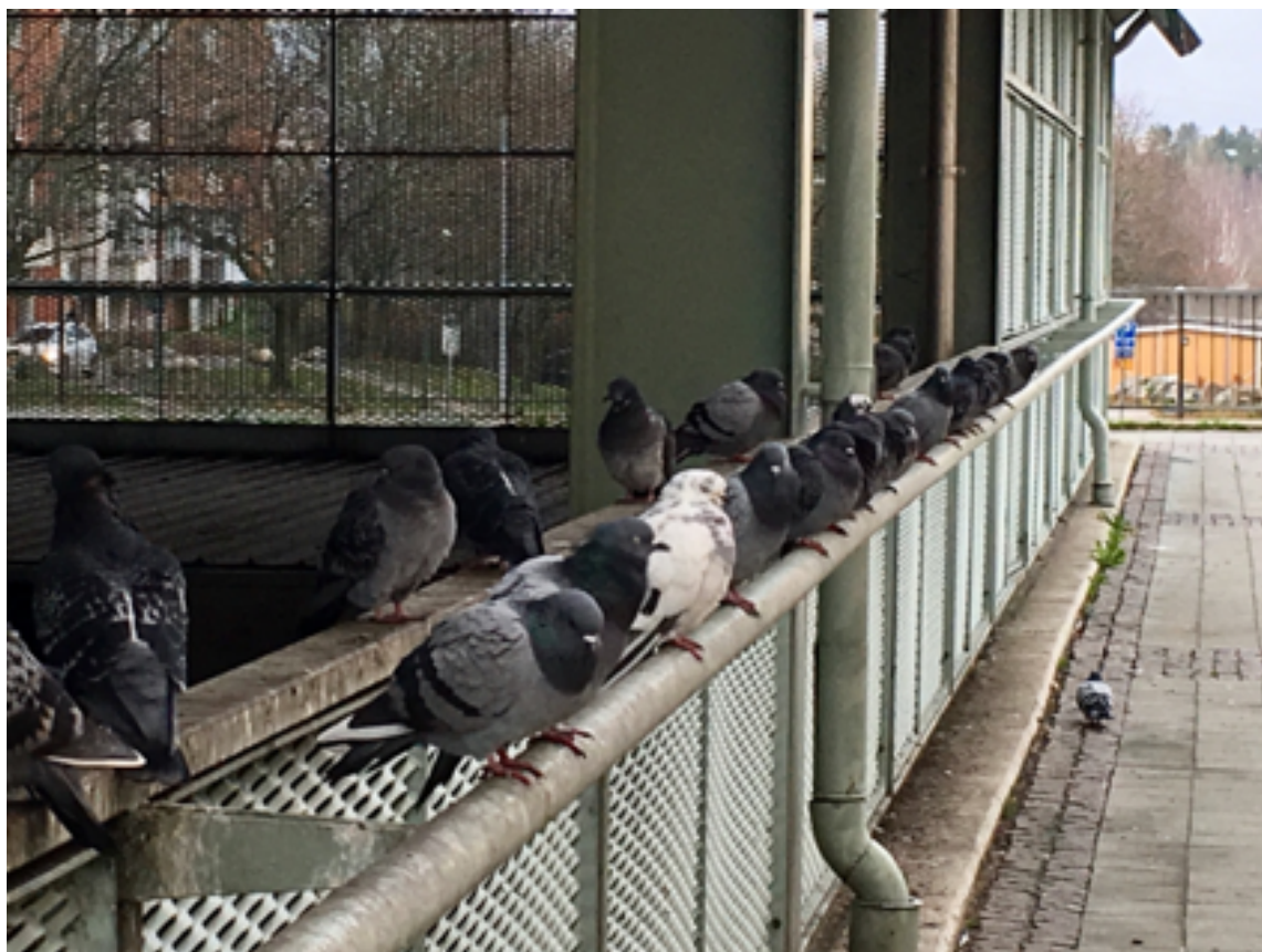
Bild av duvorna som sitter på räcket som omfamnar Akalla bussterminal.

Brf Porkala har tagit initiativ till att samla bostadsrättsföreningar i Akalla för att verka för en renare och tryggare stadsdel. Detta genom att tillsammans uppmärksamma Stockholms stad på den sanitära olägenhet som råder i och omkring Akalla bussterminal.