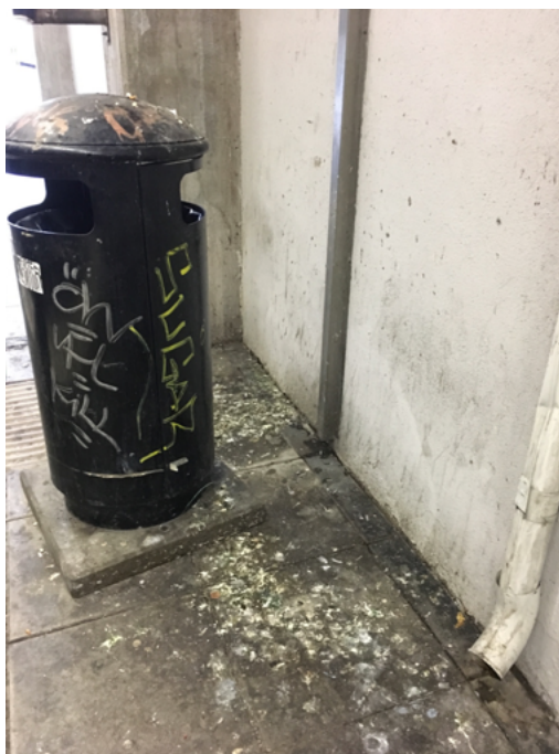
Akalla bussterminal