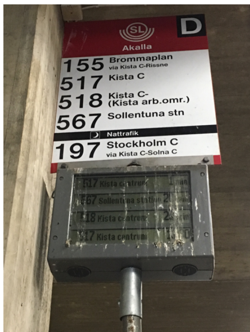
Akalla bussterminal.

En felanmälan av Akalla bussterminal kommer göras via Stockholms stads app, Tyck till-appen , med vilken Stockholms stad uppmanar medborgare att lämna in synpunkter på trafik- och utemiljön i Stockholm. Detta för att bidra till en renare och tryggare stad 2 , vilket helt överensstämmer med föreningarnas avsikt. Även denna artikel och ett formellt brev kommer att skickas till Trafikförvaltningen för att uppmärksamma situationen i vår värdjan till förbättring.